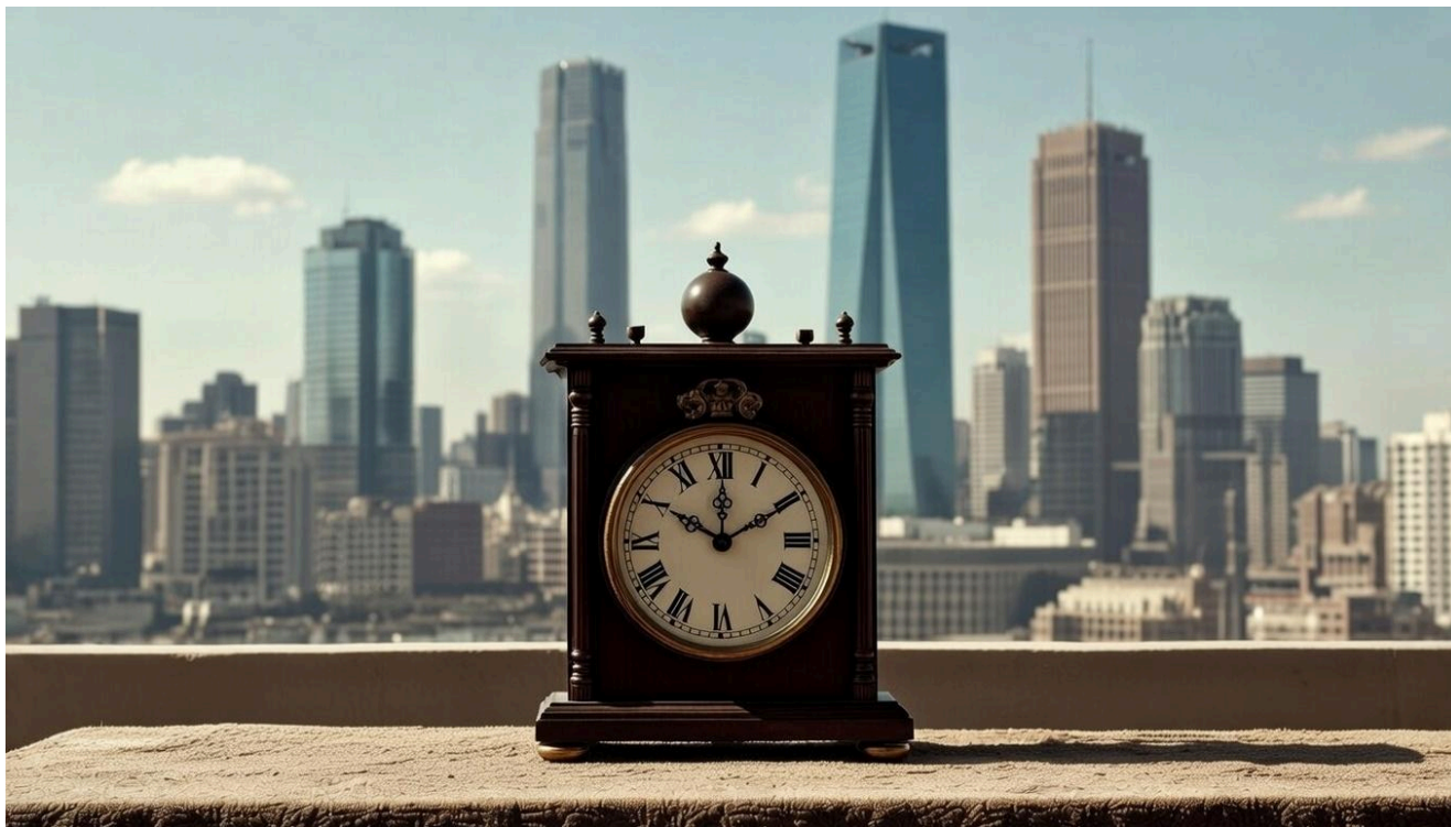
Рисунок 1 - Ваше время ограничено. На что вы его тратите: на "поиск себя" или на результат?

С нашей точки зрения, действительная победа над страхом смерти заключается не в прыжках с парашютом и не оргиях, а в дисциплине. Когда ты можешь проснуться в 5:30 утра, сделать зарядку, поесть, прочесть учебник или поработать над проектом. Занимаясь своим делом, Вы создаете и строите будущее, причем то, что переживет Вас в долгосрочном смысле этого слова. Вы не ловите момент, а создаете в целом это самое будущее. С нашей точки зрения, «жить здесь и сейчас» воспитывает тенденцию к сиюминутным удовольствиям и поиску веселья. Но способность откладывать удовлетворение на потом – это и есть то, что отличает действительно взрослого и зрелого мужчину от вечного подростка, которого тревожит тема смерти. Цена успеха высока и успеха нельзя никак добиться «ловлей момента здесь и сейчас».