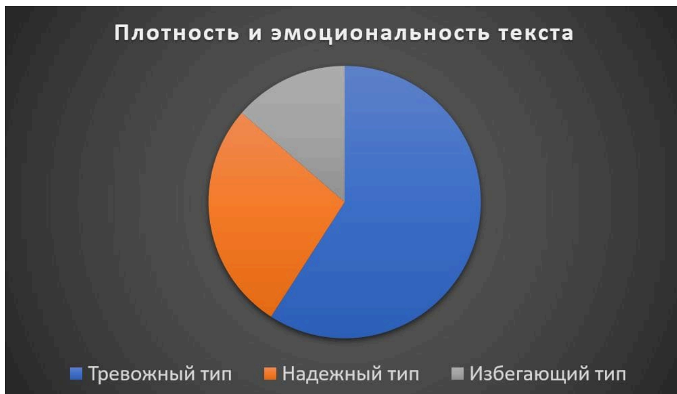
Рисунок 2 – Плотность и эмоциональность текстового потока у мужчин разного типа привязанности

физически Вы можете находиться в разных городах/странах.