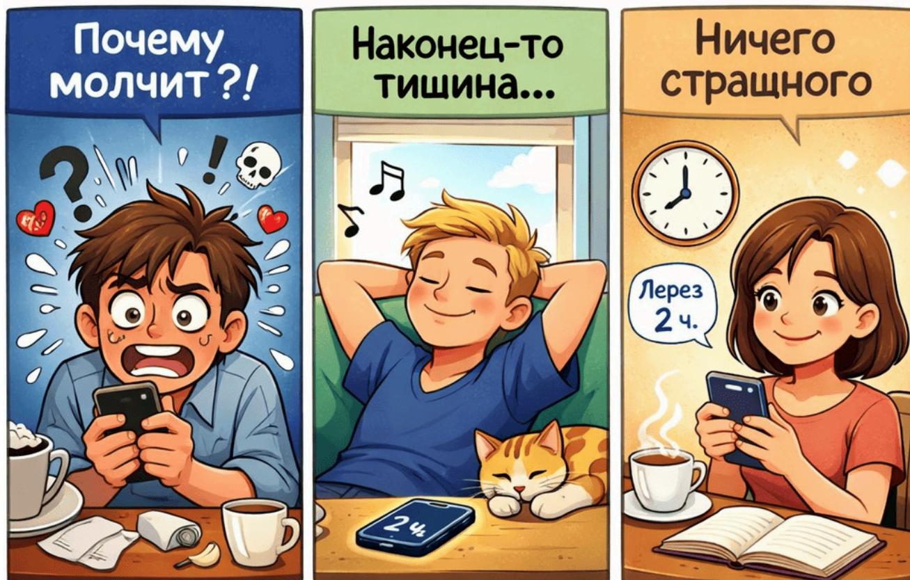
Рисунок 1 – Типы привязанности, которые проявляются в переписке

Рассмотрим каждый тип привязанности и опишем данные маркеры поведения более подробно: